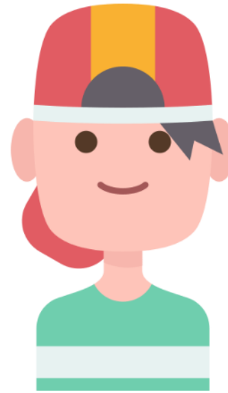
Bruce, 22 jaar